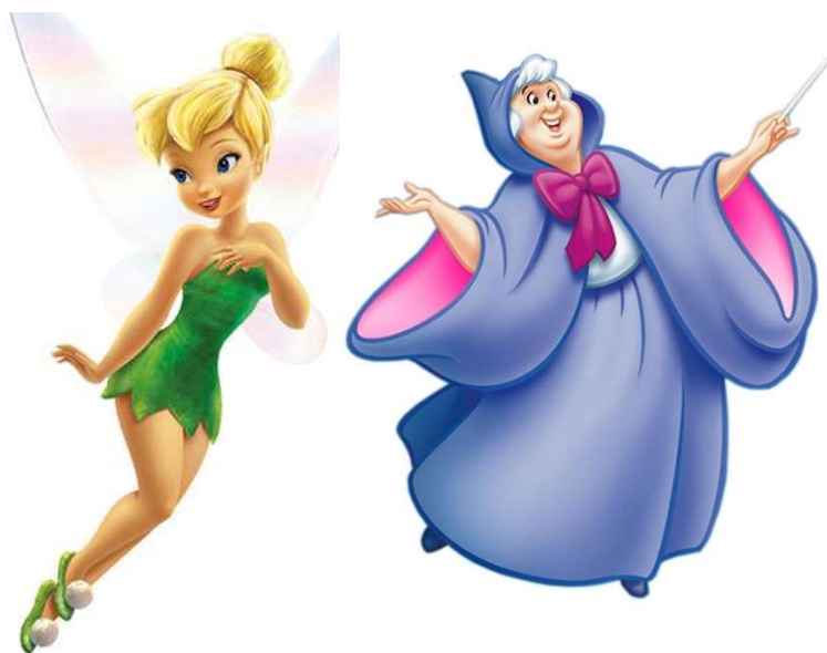
FADA TINKER BELL