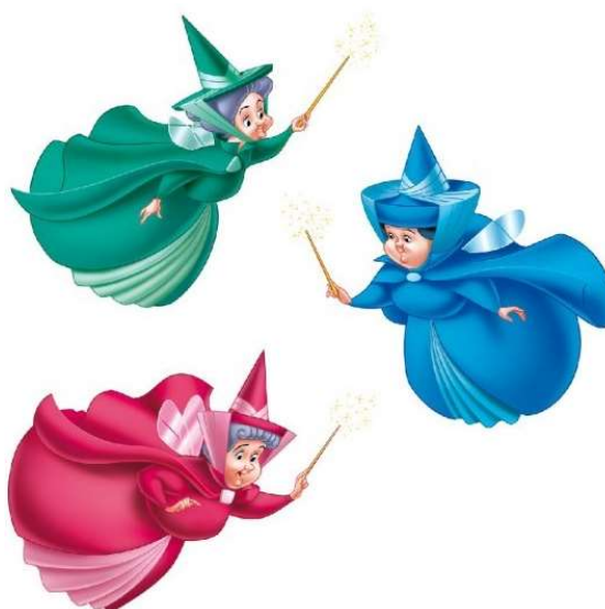
FAUNA, FLORA E PRIMAVERA AS FADINHAS DA BELA ADORMECIDA

HOJE A NOSSA BRINCADEIRA E A NOSSA ATIVIDADE SERÁ SOBRE FADAS E ELFOS. PRIMEIRAMENTE VAMOS CONSTRUIR ACESSÓRIOS PARA PODEREM BRINCAR NESSA MAGIA DA IMAGINAÇÃO. AS MENINAS SERÃO AS